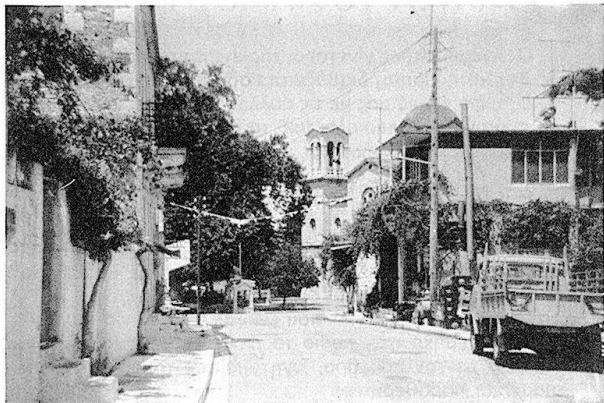
ΒΡΕΣΘΕΝΑ. Ο κεντρικός δρόμος με την πλατεία του χωριού.