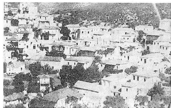
ΧΡΥΣΑΦΑ. Μερική άποψη του χωριού.

Καθ' όμοιο τρόπο και τα εις -ας οικογενειακά ονόματα τοπαρχών, απ' όπου έγιναν ονόματα συνοικισμών, για να ικανοποιηθούν το γλωσσικό τους αίσθημα οι άνθρωποι, αφού δεν υπάρχουν ουδέτερα ουσιαστικά με κατάληξη -α στον ενικό, τα έκαναν ουδέτερα πληθυντικού αριθμού και ανέβασαν τον τόνο στην παραλήγουσα και είπαν το χωριό του Χρυσάφα - τα Χρύσαφα, δηλαδή η κατάληξη έγινε αιτία μεταβολής του γένους και αριθμού. Όμοιος είναι ο σχηματισμός πολλών τοπωνυμίων του Πάρνω-